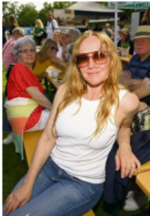
Bühnen- und Fernsehstar Brigitte Hobmeier.

Ebenfalls dabei waren: Moderator Jochen Bendel , der witzig und mitreißend durch den Nachmittag führte, Schauspieler Francis Fulton-Smith , der direkt vom Filmfest nach Ismaning kam, Fernsehmoderatorin Julia Leischik , die die Besucher von ihrer emotionalen Show „Bitte melde Dich“ kennen, der