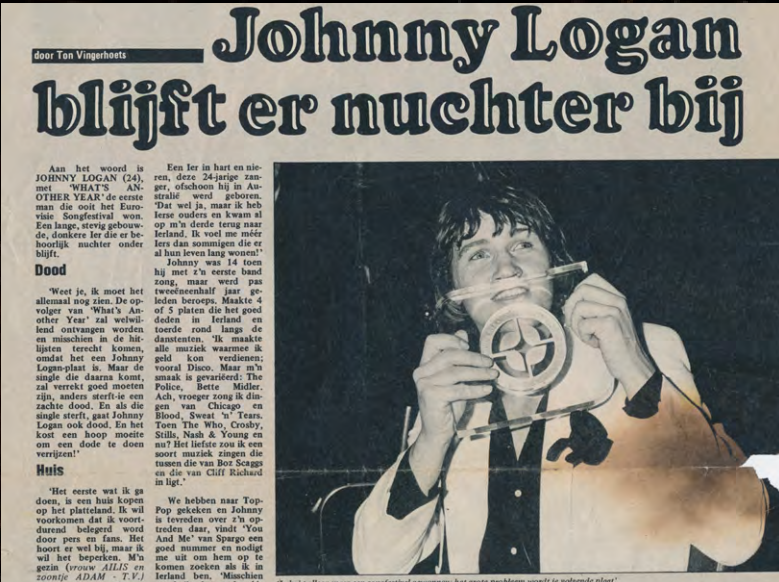
Me & my first Eurovision Trophy