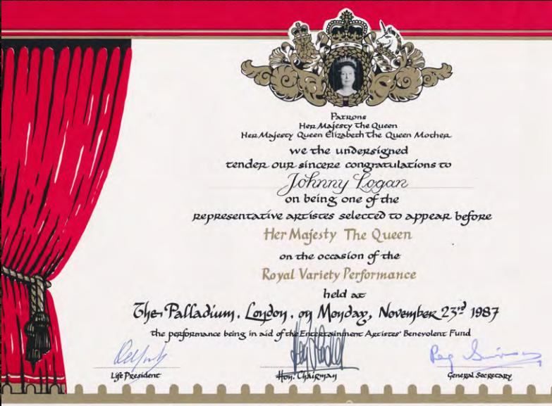
My invitation to perform at the Royal Variety Performance at the Palladium in London - a very proud moment in my career