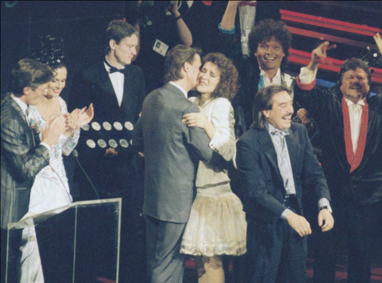
Congratulating Celine Dion in Dublin 1988