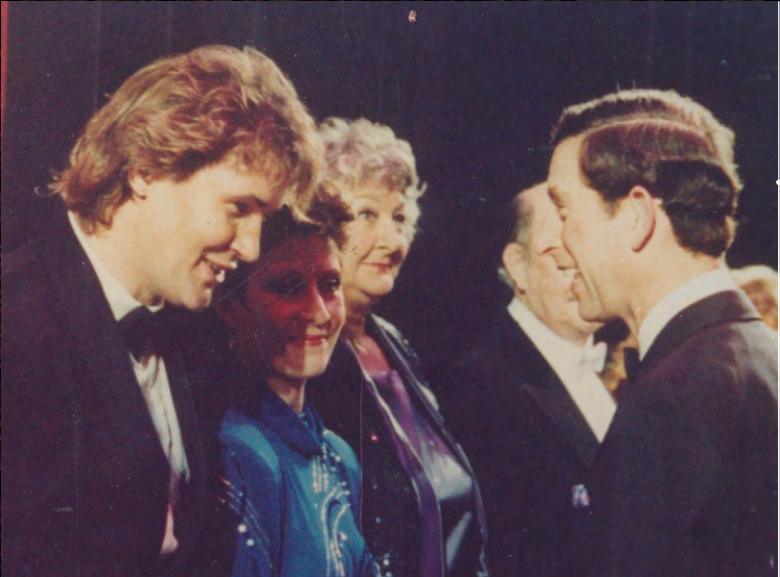
A short talk with Prince Charles after a performance in there 80th.