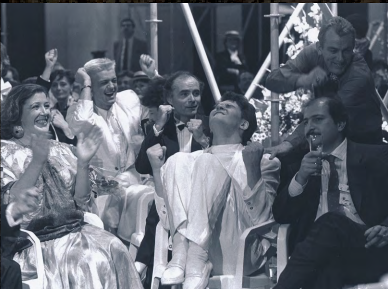
That winning moment - Backstage in Brussels in 1987