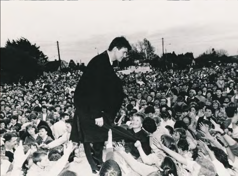
Arriving back in Ashbourne with the 2nd. Eurovision Trophy