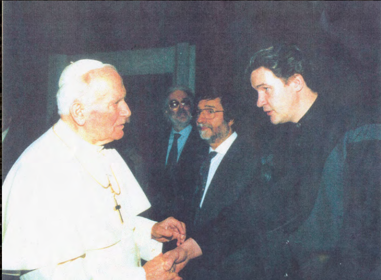
Meeting the Pope Jean Paul before my performance in the Nervi Hall -Vatikan City