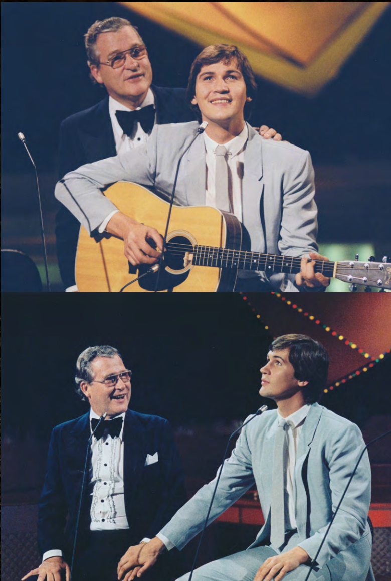
Singing with my father on a TV-Special for RTE 1980