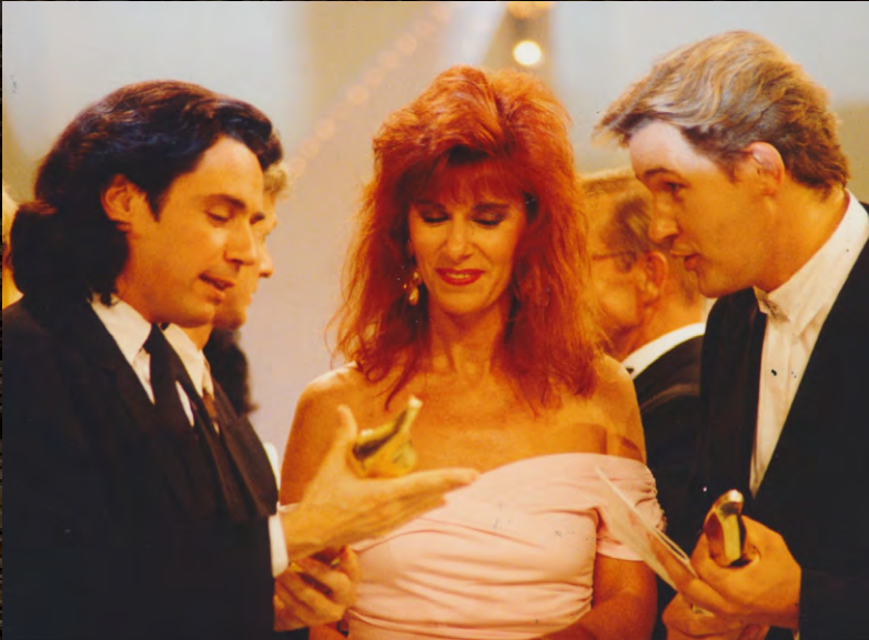
Myself & Linda Martin receiving an award in Germany after the 1992 Eurovision win „Why Me“