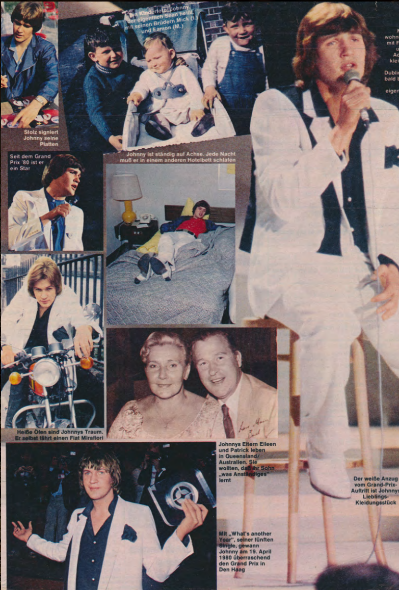
Compelation of photos from 1980 with my parents