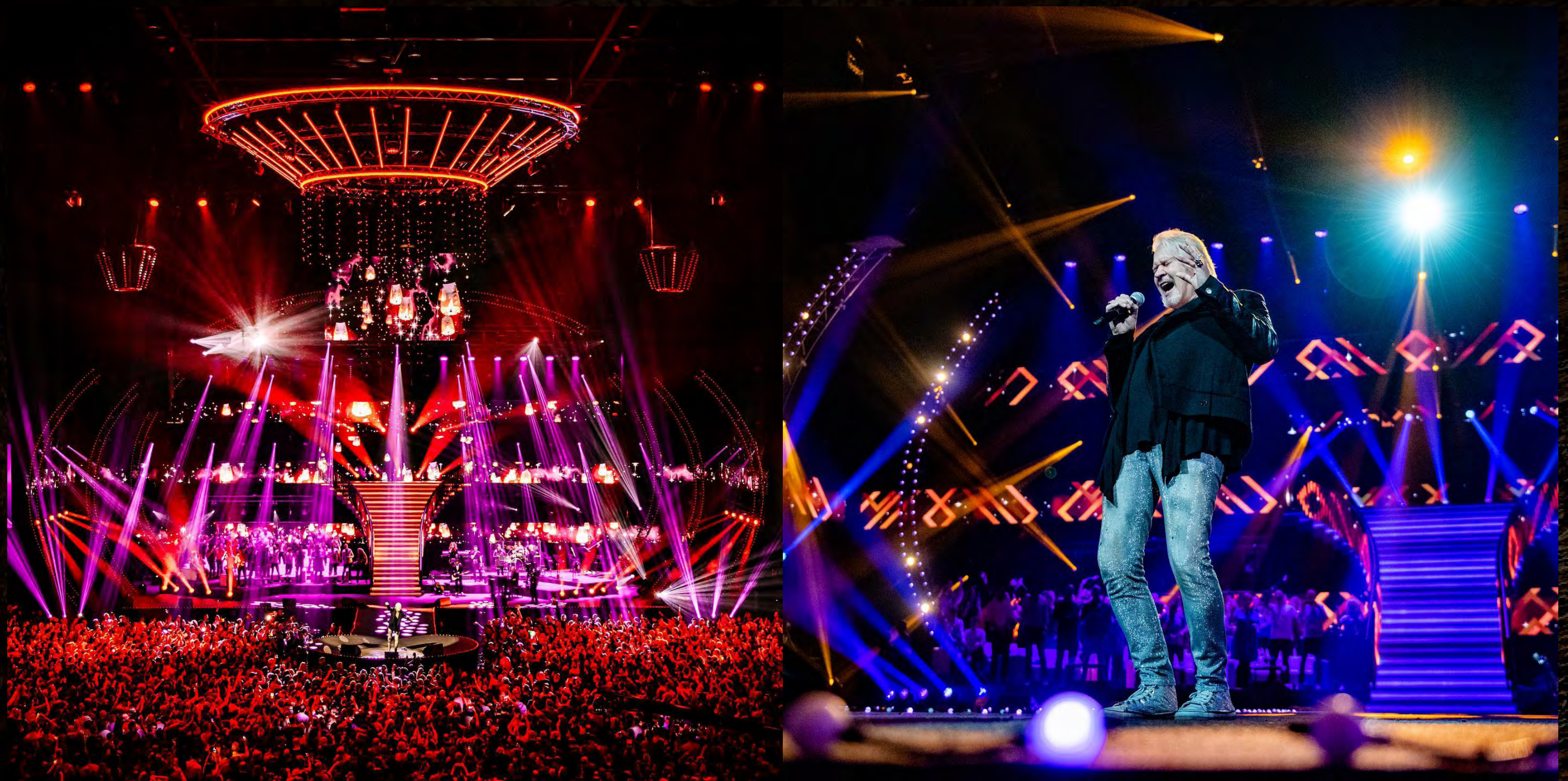
„Het Grote Songfestivalfeet”