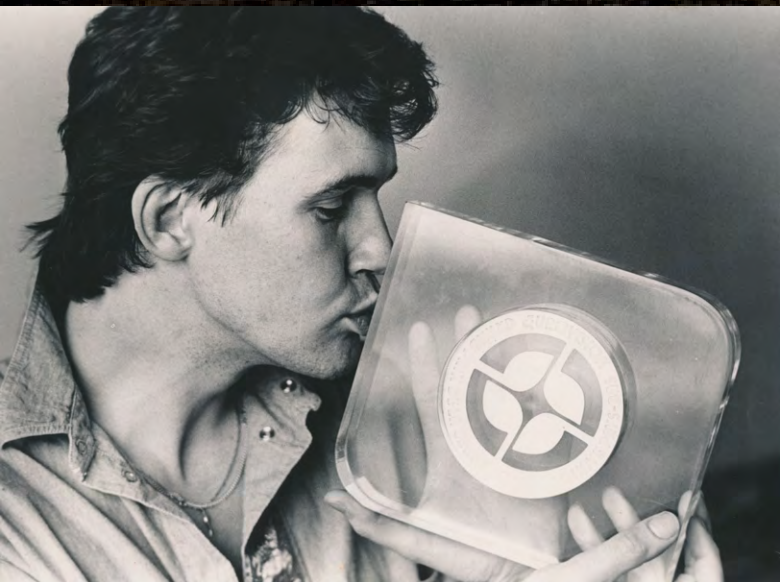
Kissing the Trophy from 1980