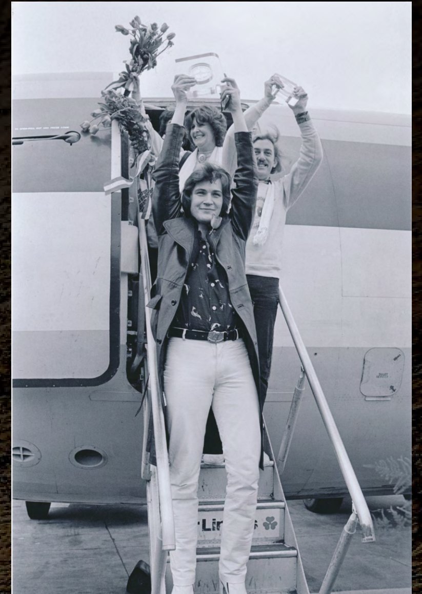
Arriving back in Dublin with the first Eurovision Trophy