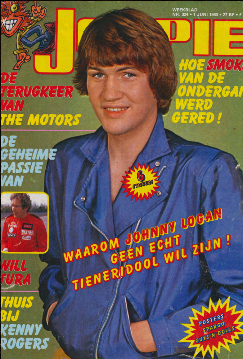
Cover of a Dutch Teen Magazine