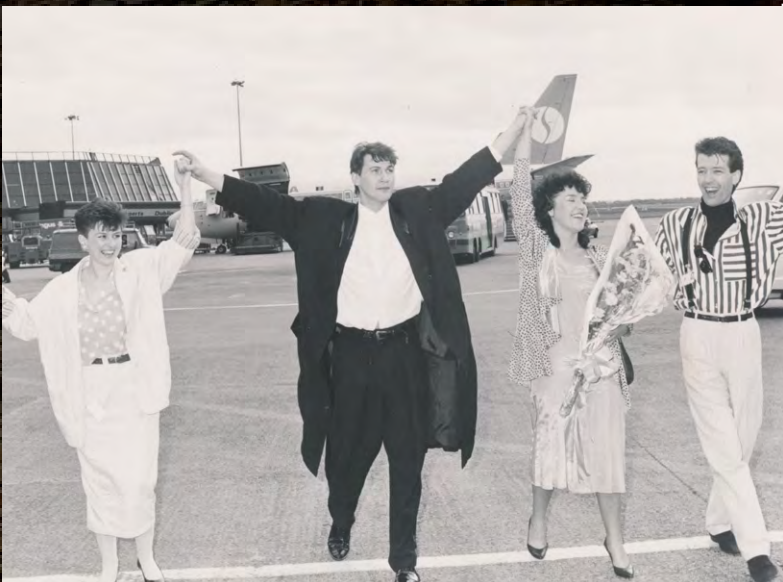
On the tarmac at Dublin Airport with the Backing Vocalists