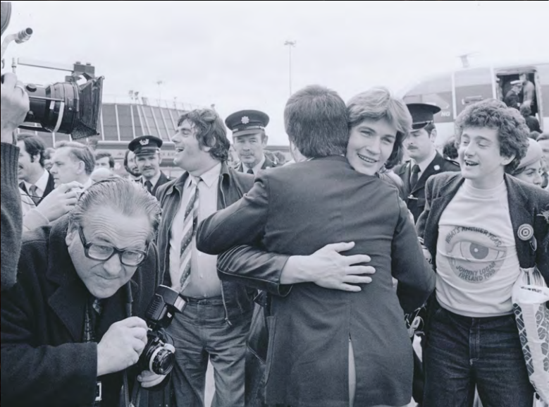
Arriving in Dublin 1980 with the Eurovision Trophy beside me, my friend & manager Louis Walsh that time