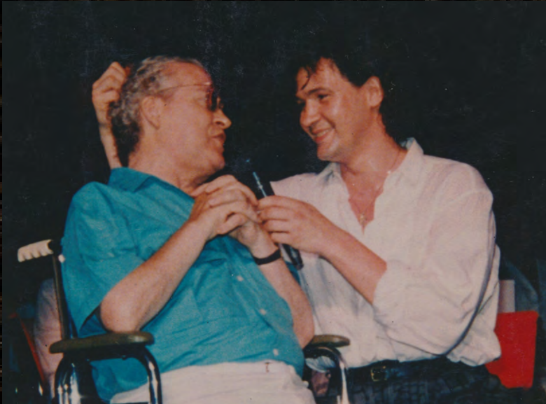
Singing „Danny Boy“ to my father in Seagulls casino /Australia