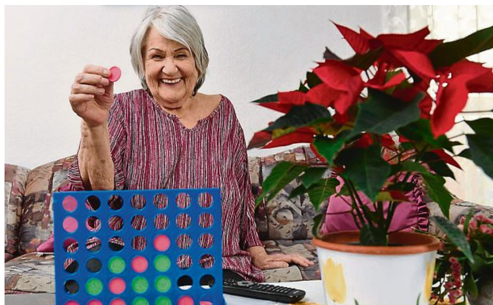
Vier gewinnt! Eveline S. ist glücklich, wenn die Seniorenassistentin vom Verein LichtBlick zu Besuch ist. Dann spielen sie – und die 80-Jährige vergisst ihre Sorgen.