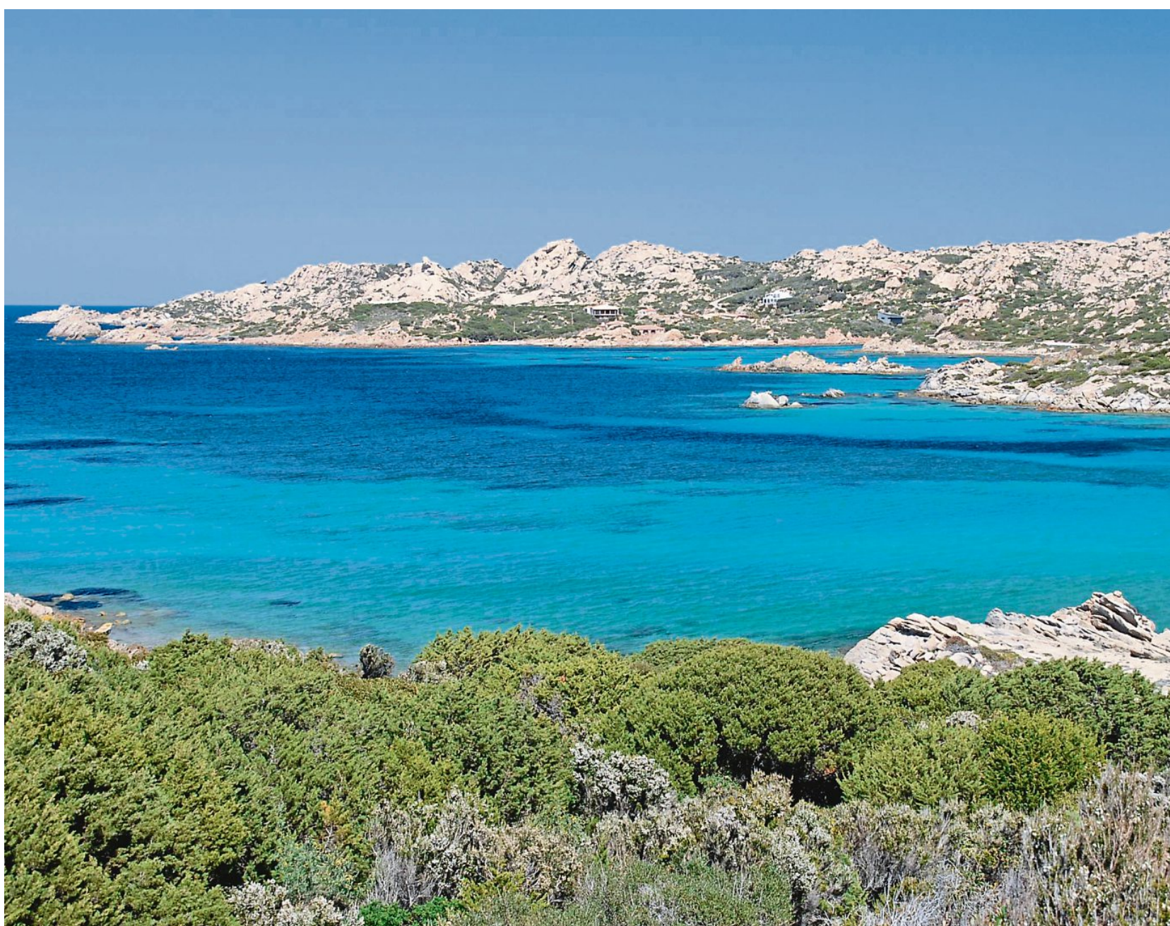
Idyllische Aussichten, auch im übertragenen Sinn: Unser Foto zeigt Berge auf Sardinien. In mehreren Dörfern leben hier Menschen, die besonders alt werden. 21 von 10 000 Einwohnern erreichten in diesen Orten ihr 100. Lebensjahr, heißt es in einer statistischen Auswertung. Ein Spitzenwert!

Sucht man nach den Gemeinsamkeiten von Poulains „blauen Zonen“, stößt man zuerst auf viele Widersprüche: Während die Japaner auf Okinawa ihren Menüplan auf Fisch und Algen aufbauen, vertrauen die Griechen ihrer mediterranen Kost. Während die Adventisten im kalifornischen Loma Linda ihre Langlebigkeit mit dem Verzicht auf Alkohol begründen, sehen die Sarden im regelmäßigen Rotweinkonsum ihren Jungbrunnen. Gibt es dennoch etwas Allgemeingültiges, was man von den „blau-