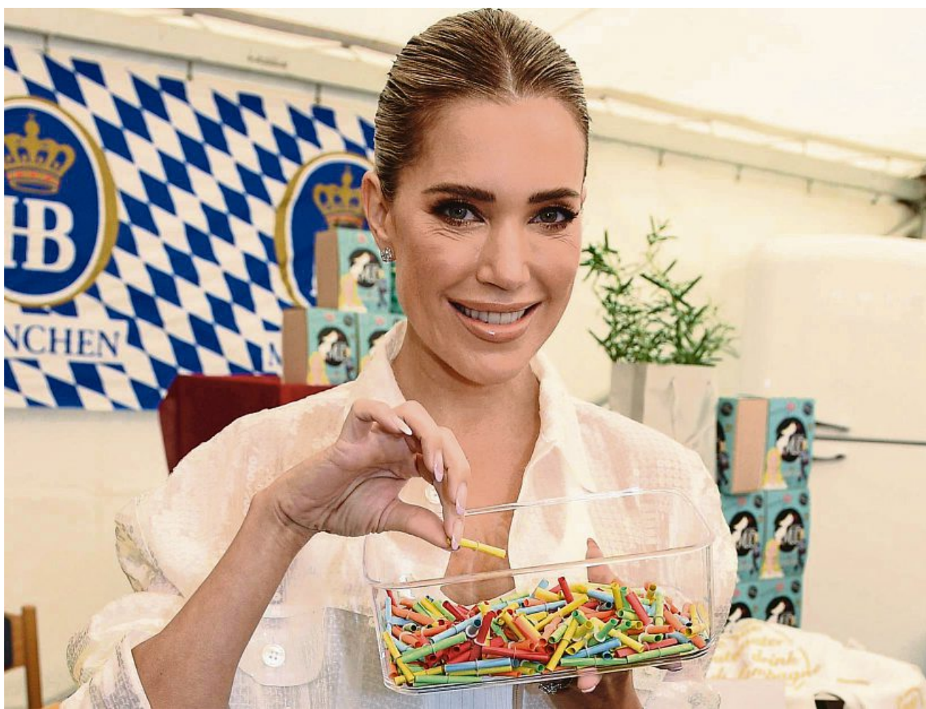
Eine charmante Sylvie Meis verkaufte Lose für die Tombola, bei der hochkarätige Preise winkten.