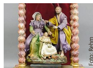
Diese Krippenfiguren aus dem Nachlass Josef Baumgartners entstanden im 19. Jahrhundert.

Ein besonderes Augenmerk gilt auch einmal mehr der Gemälderub-