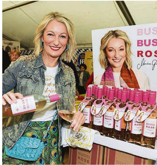
Wohl bekomm's: Monika Gruber spendierte ihren neuen Bussi-Bussi-Rosé.