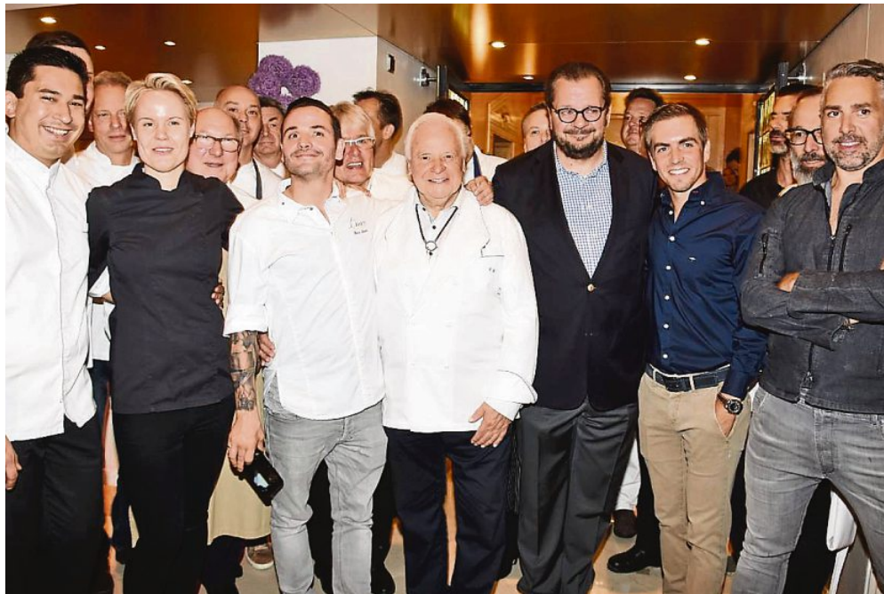
Insgesamt 18 Spitzenköche servierten Ex-Fußballer Philipp Lahm (4 v.r.) sowie 250 weiteren geladenen Gästen im Münchner Königshof ein exquisites Menü.

Insgesamt 7000 Teller wurden bei der mittlerweile elften Auflage von „Fauster & Friends“ angerichtet, mit Köstlichkeiten wie mariniertem Zander mit Safran und